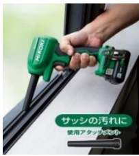
サツンの汚れに 使用アタッチメント

コードレスエアダスタ HiKOKI RA18DA形・RA12DA形 軽くて高風速。 手軽で小回りがきくから仕事にもレジャーにも！