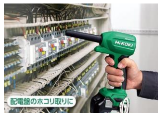
配電盤のホコリ取りに