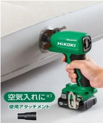
空気入れに 使用アタッチメント