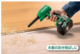
木屑の吹き飛ばしに