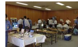
昨年の展示会の様子